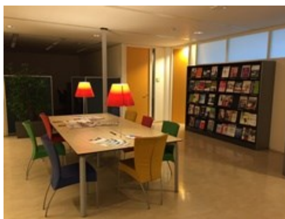
Gjesteforskerskontor hos NIVEL