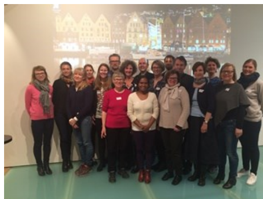
Blide kursdeltakere og forelesere i Bergen

Litt sosialt var det også tid til, og tirsdagen gikk vi ut sammen og spiste middag. En fin mulighet til å bli bedre kjent. NAFALM er stolt av å få arrangere dette kurset, og vi takker kurskomiteen for god gjennomføring og kursdeltakerne for god innsats gjennom hele kurset.