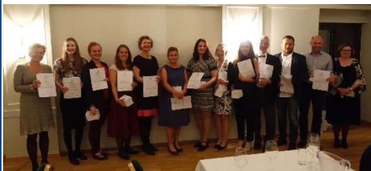
Kull 4 med sine diplomer.