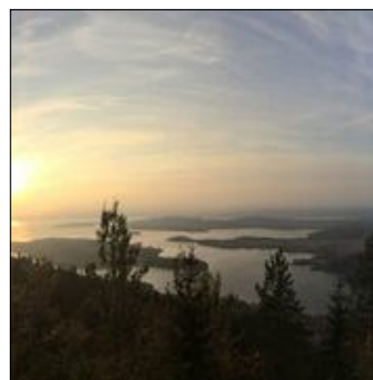
Kongens utsikt.

Forskerskolens tredje studentkull er nå tatt opp. Kull 15 består av 15 studenter,, og totalt er nå 51 ph.d-studenter tatt opp på Forskerskolen. Som i tidligere kull er det både leger, sykepleiere og en antropolog blant studentene. De representerer alle fire universitetene, og alle prosjektene er allmenmedisinsk relevante. Vi gleder oss til tre spennende år med vår nye studentgruppe, og ser frem til å møte dem alle på vårt oppstartsseminar på Sundvolden 16.-18.september!