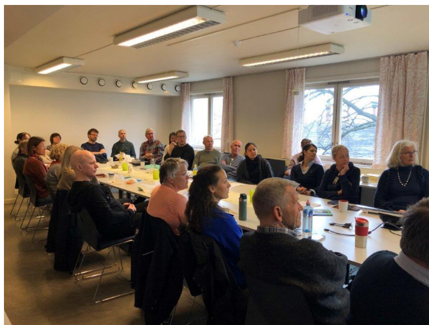
Fullt rundt bordet på forskningsmøte