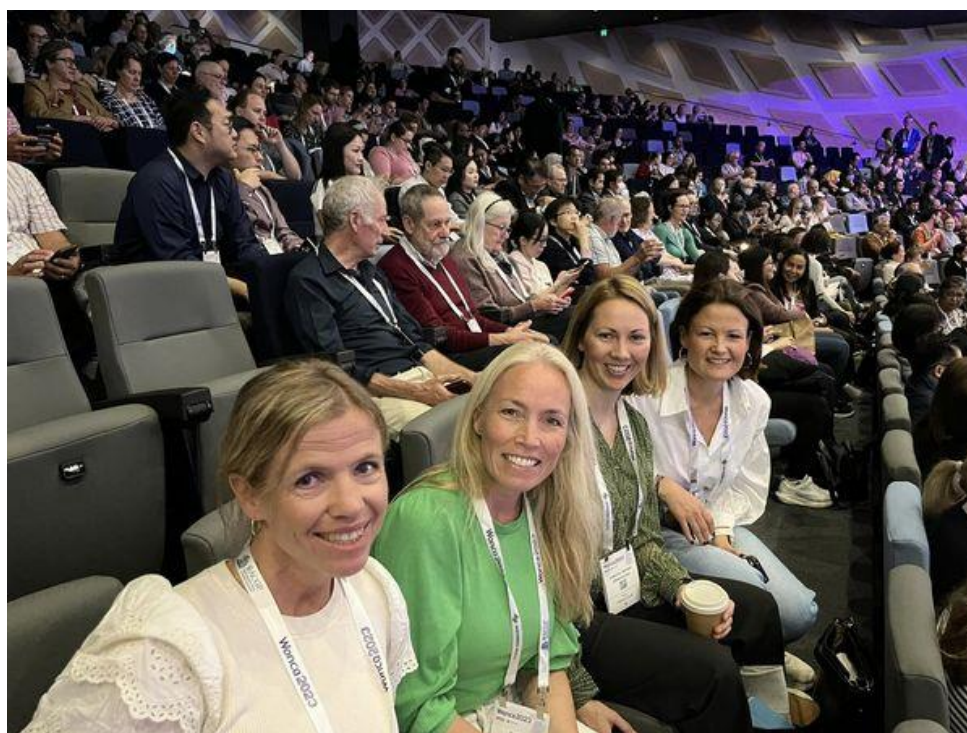
Blide stipendiater på plass under WONCA World i Sydney i november 2023.