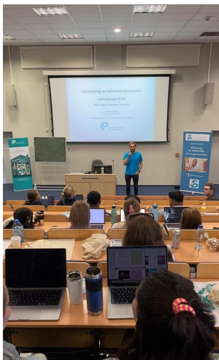
ASP underviser norske medisinstudenter i Warsawa

Arbeidet med RASK har vist hvor viktige sykepleiere er i antibiotikastyring på sykehjem. ASP har derfor sammen med vår søsterorganisasjon i spesialisthelsetjenesten NSAS (Nasjonalt senter for antibiotikabruk i sykehus) og Folkehelseinstituttet laget en utdanningsmodul om infeksjoner, antibiotika, resistens og smittevern for bachelorutdanningen i sykepleie. Høsten 2023 gjennomførte vi både digital og fysisk undervisning for undervisere slik at de kan gjennomføre undervisningsopplegget på sine studiesteder. Et eget e-læringskurs for sykepleiestudenter, tilpasset det øvrige undervisningsopplegget, er også utviklet i 2023.