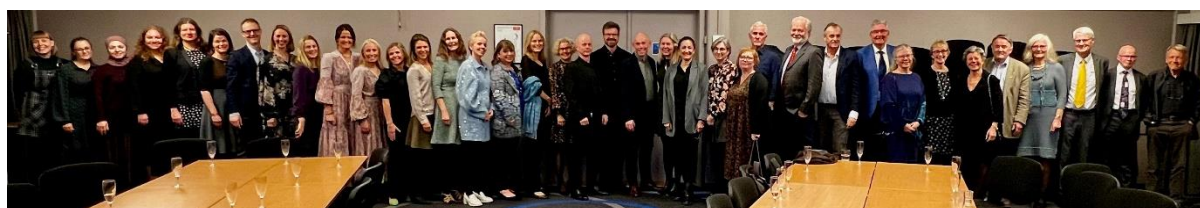
Ansatte ved avdelingen oppstilt etter alder