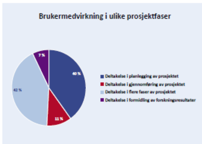
Figur 16: Andel midler til prosjekter med brukermedvirkning, fordelt på hvilke faser brukerne har deltatt i. Totalt 659,3 millioner kroner. Data fra eRapport.