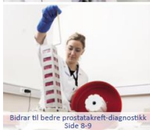
Bidrar til bedre prostatakreft-diagnostikk Side 8-9