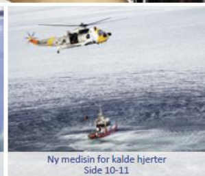
Ny medisin for kalde hjerter Side 10-11