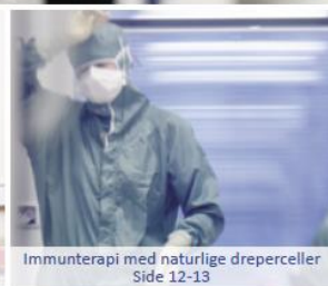
Immunterapi med naturlige dreperceller Side 12-13